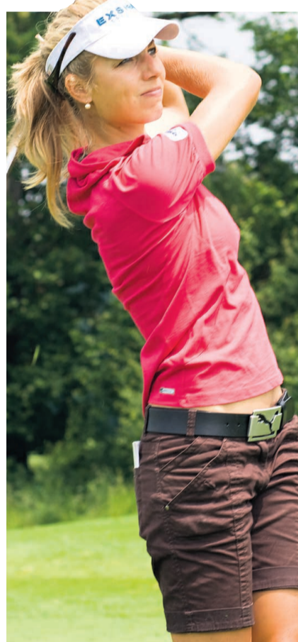
Viel Dynamik beim Abschlag

Mit der Telia Tour bietet Schweden eine Profimeisterschaft für Frauen an. Neben Schwedinnen bestritten 15 internationale Spielerinnen, vorwiegend aus den nordischen Ländern, diese Tour. Obwohl die Golfsprache Englisch ist, sprach der Grossteil der Spielerinnen unter sich